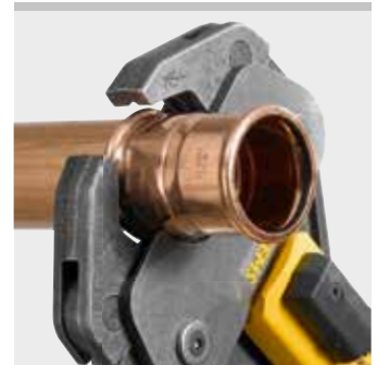
REMS Presszange (4G)