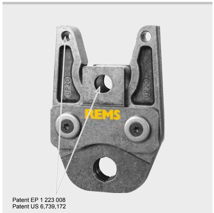
Patent EP 1 223 008 Patent US 6,739,172

Mit dieser Rückverfolgbarkeit erfüllt REMS die Empfehlungen der Europäischen Norm EN 1775:2007 bei der Installation von Pressfitting-Systemen für Gas.