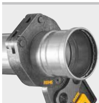
REMS Pressring (PR-3B)