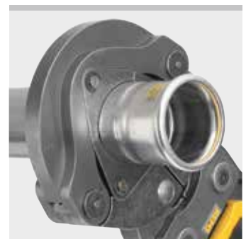
REMS Pressring (PR-3S)