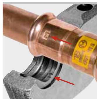
Beispiel REMS Presszange M: Abdruck "M" auf gepresstem Fitting zur Rückver- folgbarkeit gemäß EN 1775:2007