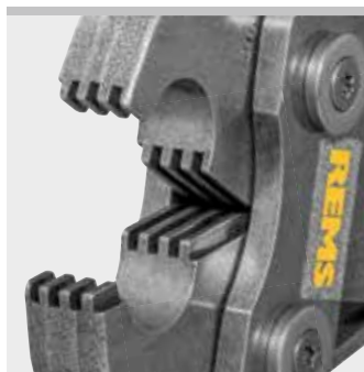
Presszange mit Verzahnung Patent EP 2 027 971