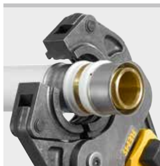
REMS Presszange (S)